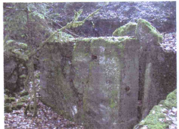
Rechts Gesprengter Bunker