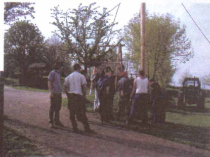
Das Wandern... Aktion Maibaum...